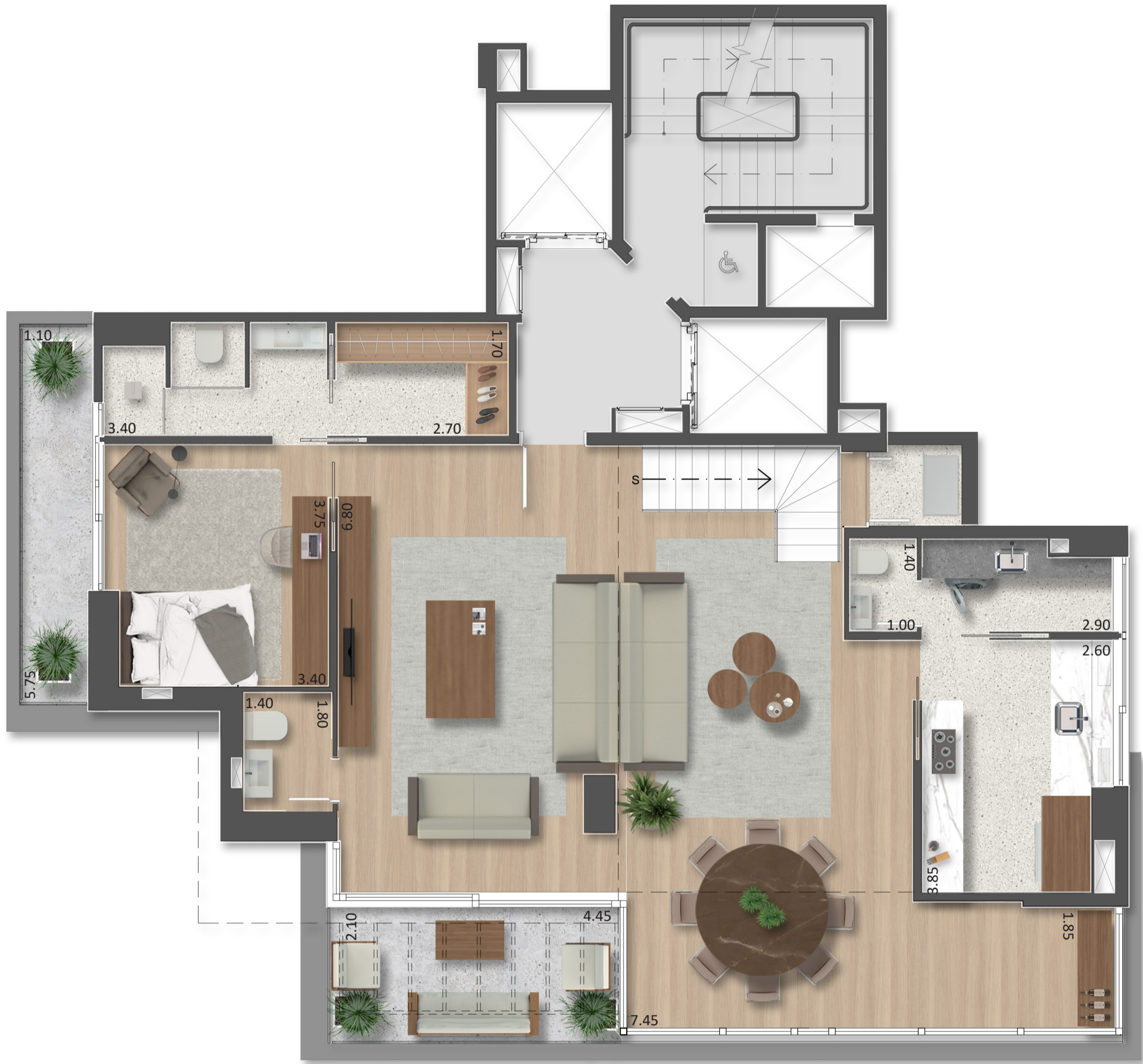
PLANTA TIPO PAR