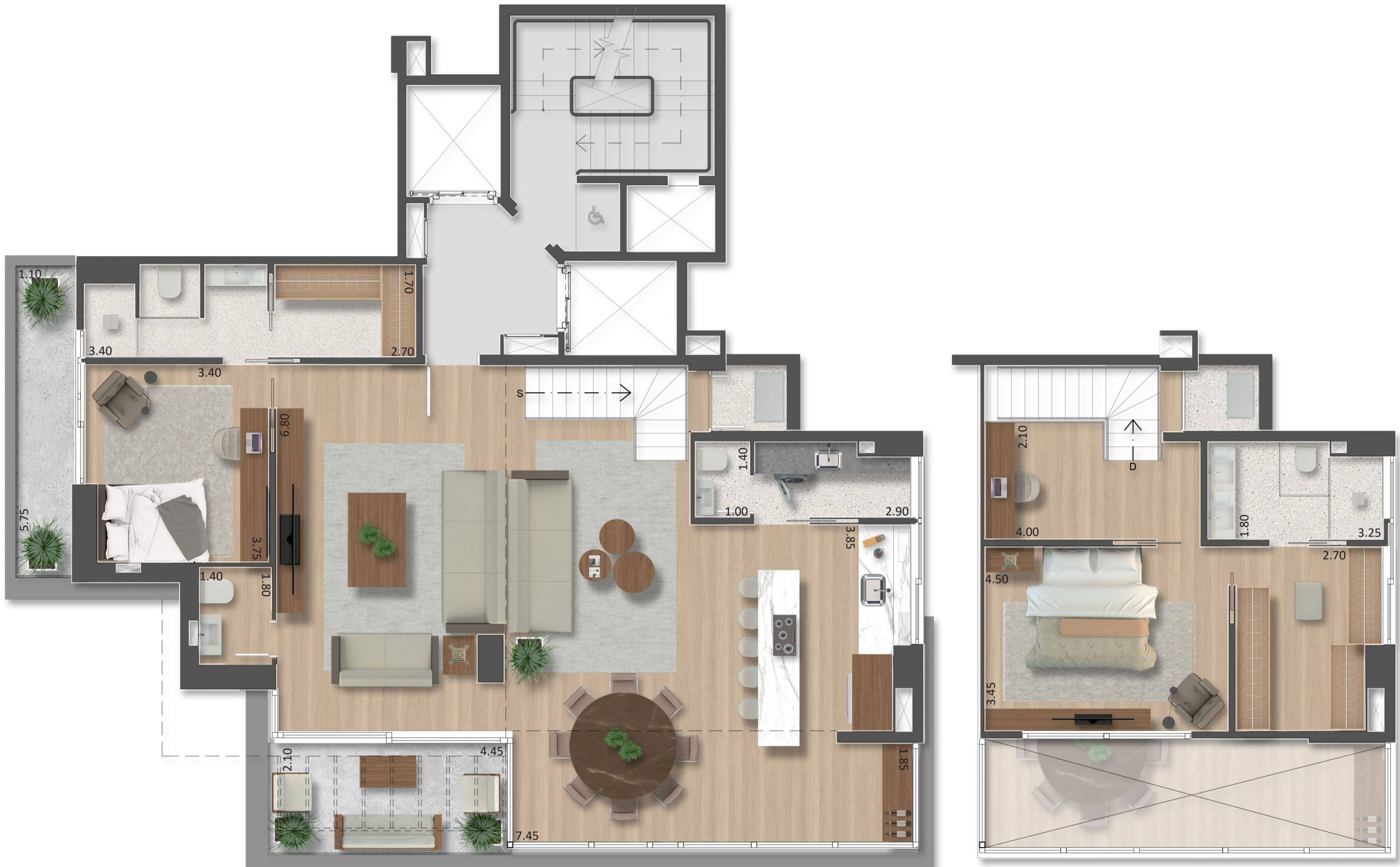
PLANTA TIPO PAR