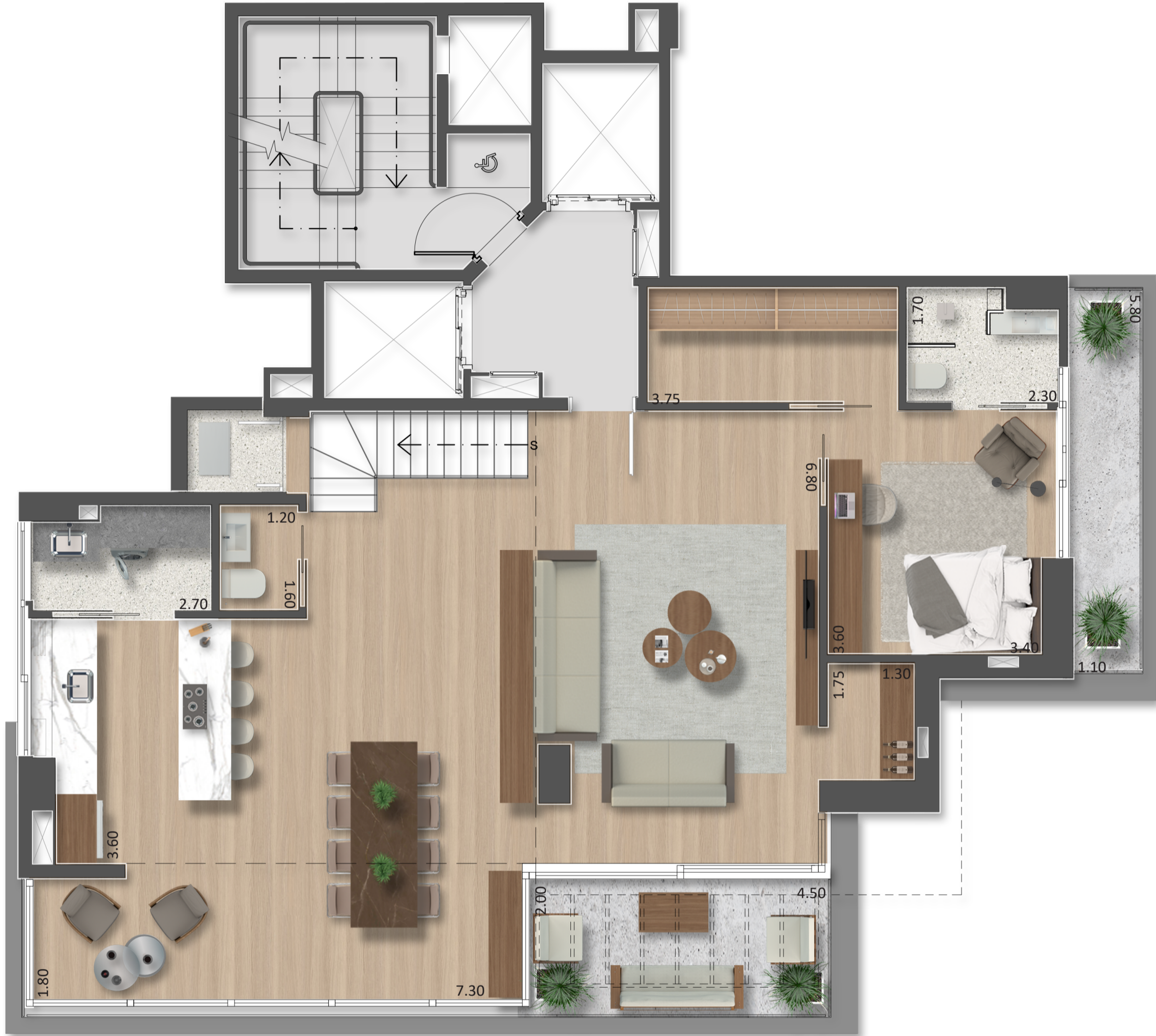
PLANTA TIPO ÍMPAR