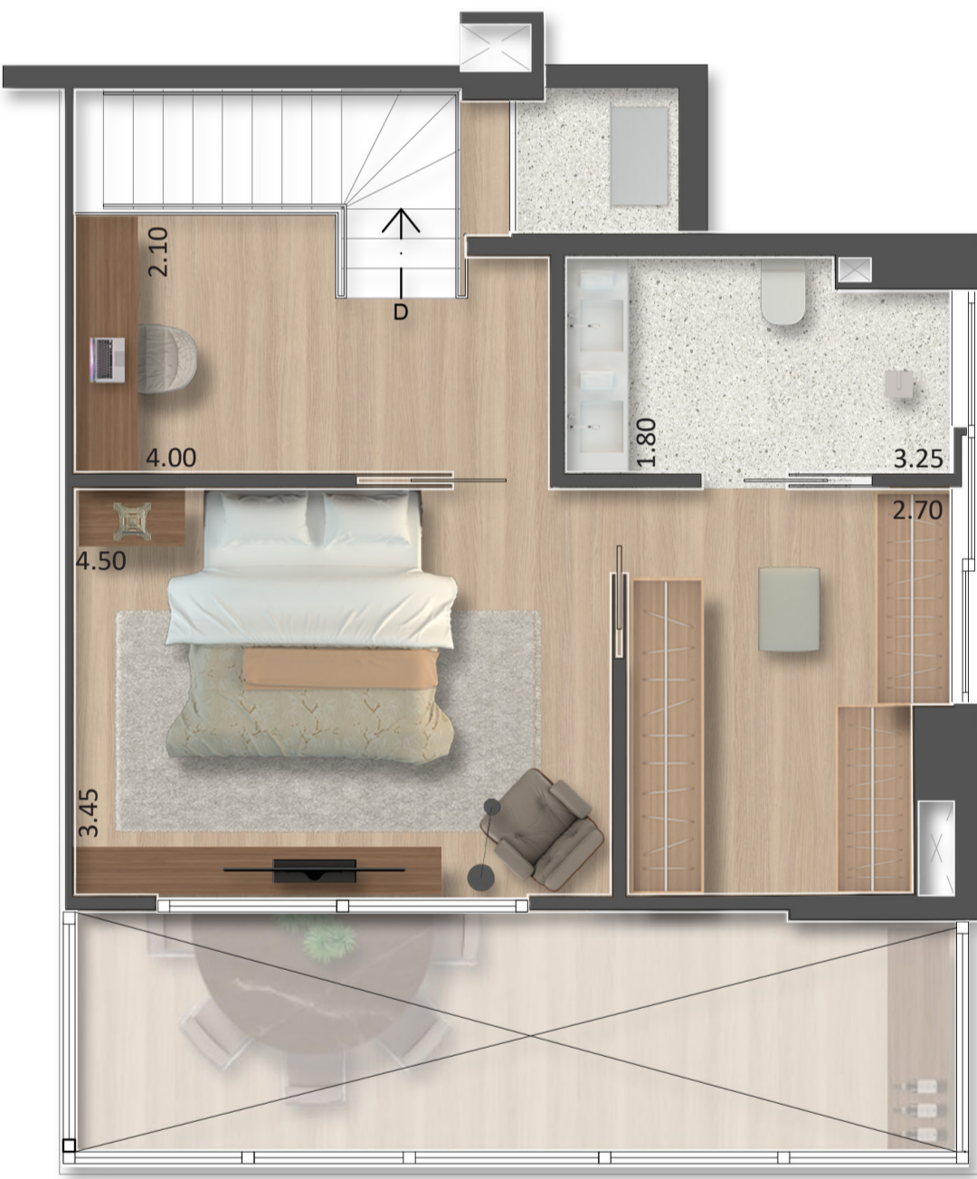
MEZANINO TIPO PAR

Arq. Flavia Burin flaviaburin@studioha.com.br www.studioha.com.br Av. Brigadeiro Faria Lima 2639 - cj. 53 - Jd. Paulistano 11 999 856 873 | 11 2507 5275